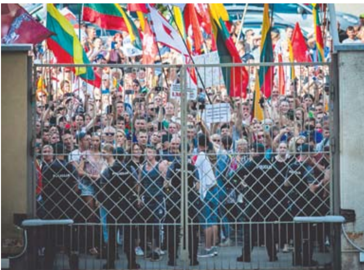
Minia, likusi už Seimo rūmų tvoros, buvo sunkiai sukalbama.