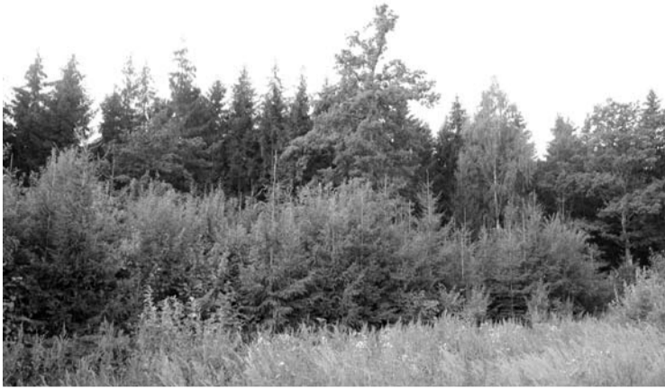
Paramos jaunuolynams ugdyti ir miškų aplinkai gerinti gali kreiptis privačių ir valstybinių miškų valdytojai, įgyvendinantys projektus kaimo vietovėse.

Iki rugpjūčio 3 d. pateikta 15 paraiškų, kuriose prašoma 22 tūkst. 648 Eur paramos. Paramos lėšas miškininkai gali panaudoti ne tik jaunuolynams iki 20 metų amžiaus ugdyti, bet ir pamiškėms formuoti, miškuose esančioms saugomoms natūralioms buveinėms atkurti, būdingai miško struktūrai palaikyti, vyraujančių nevietinių medžių rūšių medynams pakeisti vietinių medžių rūšių medynais, taip pat vidinės miškotvarkos ir miško želdinimo bei žėlimo projektams kaip savarankiškai investicijai rengti. Priemonė