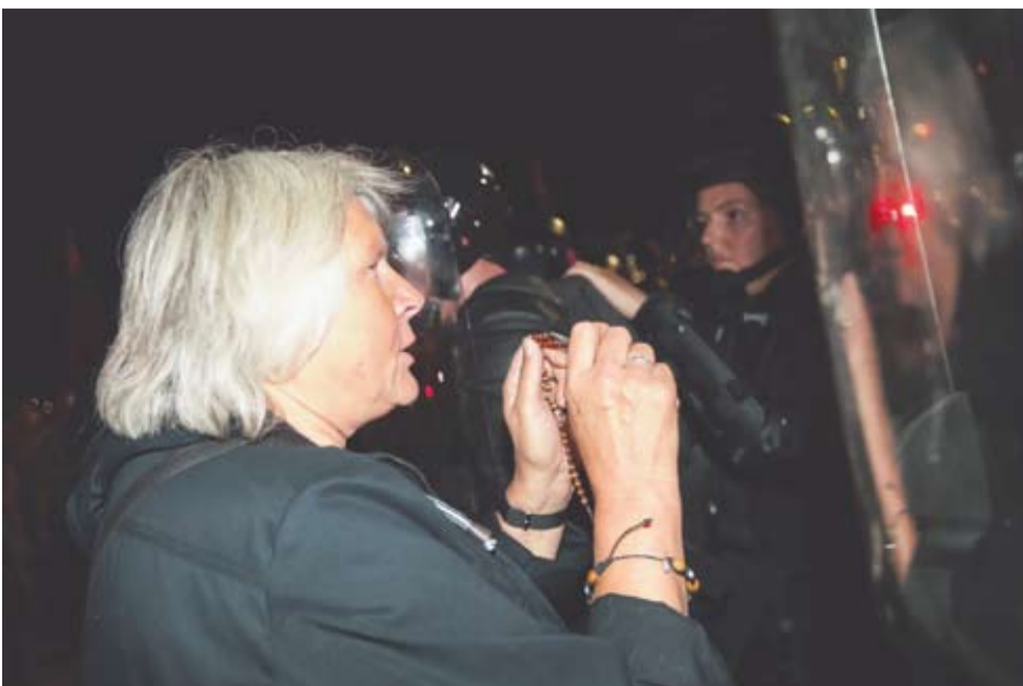
Kryželiu prieš skydą...

Ministrų kabinetas anksčiau yra pritaręs, jog augant užimtų COVID-19 lovų ligoninėse skaičiui būtų įvedami kontaktinės veiklos ribojimai neturintiems galimybių paso, išskyrus kai kurias išimtis.