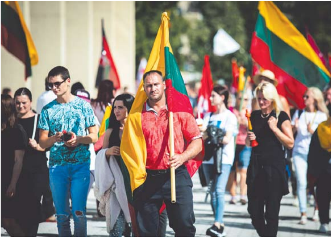
Skirtingų šaltinių duomenimis, mitinge dalyvavo nuo 4 iki 20 tūkst. žmonių.