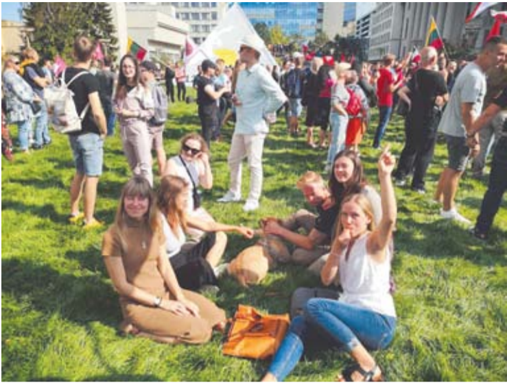
Mitingas dieną vyko taikiai.