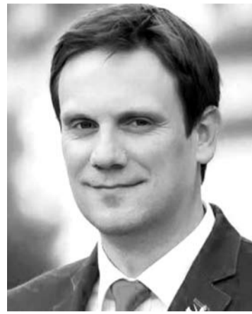
Seimo narys Tomas Tomilinas bandė atsakinėti į protestuotojų klausimus.

„Vakar teko bendrauti su piktais protestuotojais nuo 18 val., iš karto po Seimo plenarinio posėdžio, prie pat Trečiųjų rūmų išėjimo. Bendravau