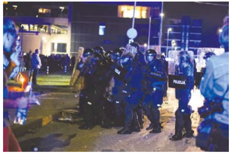
Per riaušes sužeista 18 pareigūnų.

Premjerė Ingrida Šimonytė pažymėjo, kad „šitoje bangoje mums mažiau rūpi skaičiuoti atvejų skaičių, o labiau rūpi