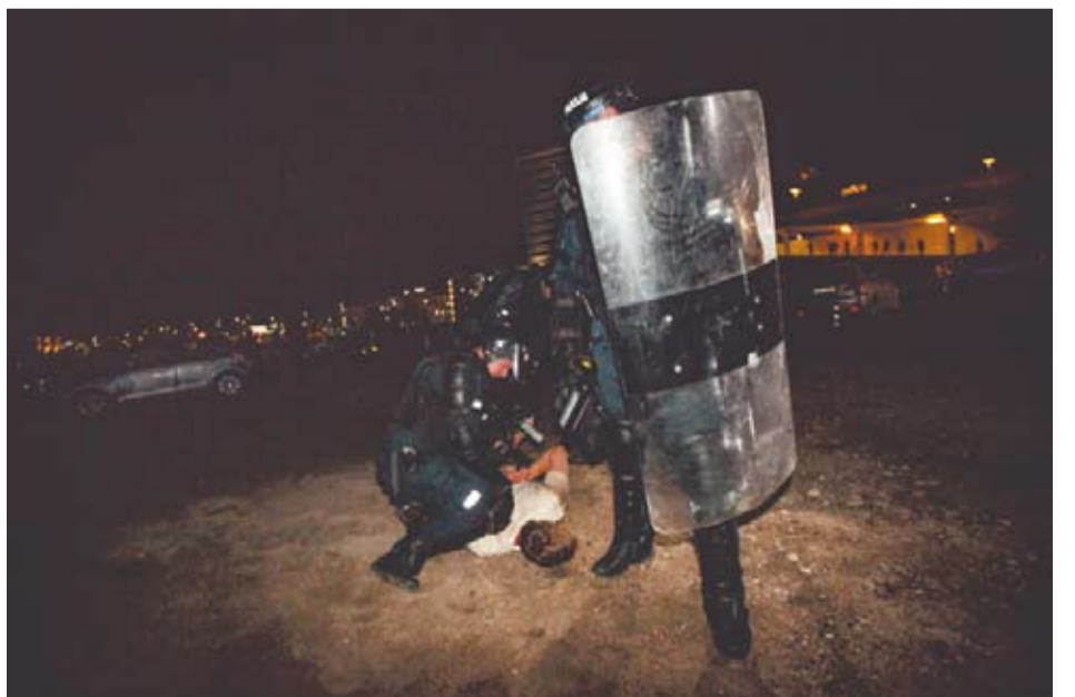
Riaušės prie Seimo prasidėjo vakarėjant.