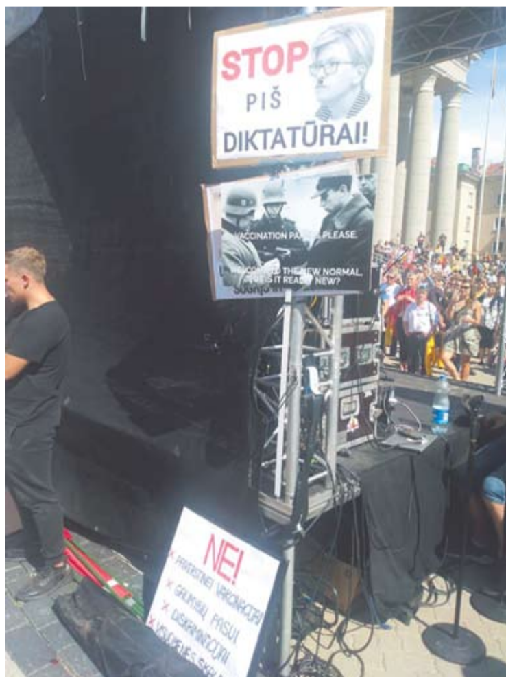
Regis, protestuotojai varžėsi, kas sukurs išmoningesnį plakatą.